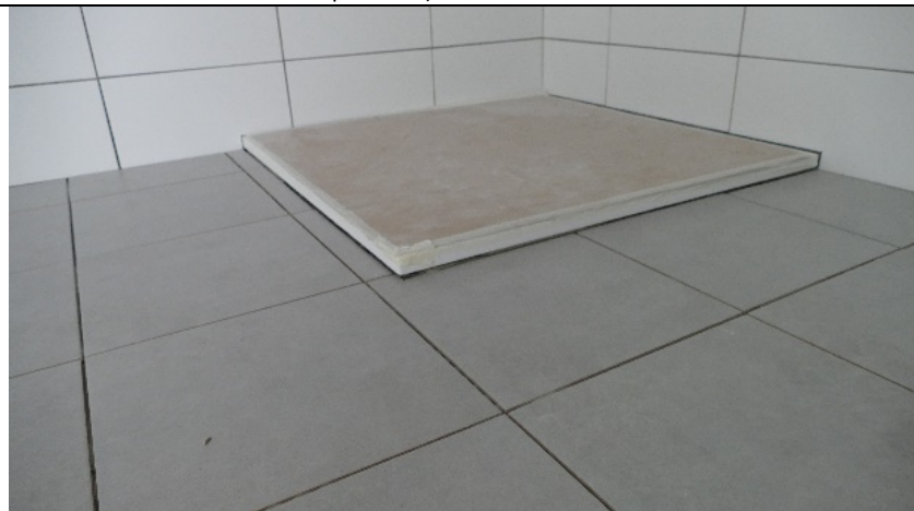
Fliesenpiegel herstellen, Wartungsfugen in der Farbe nach Wahl des AG's ausführen, vor Übergabe den Bauschutz entfernen und den Sifonteil samt Abdeckung einsetzen