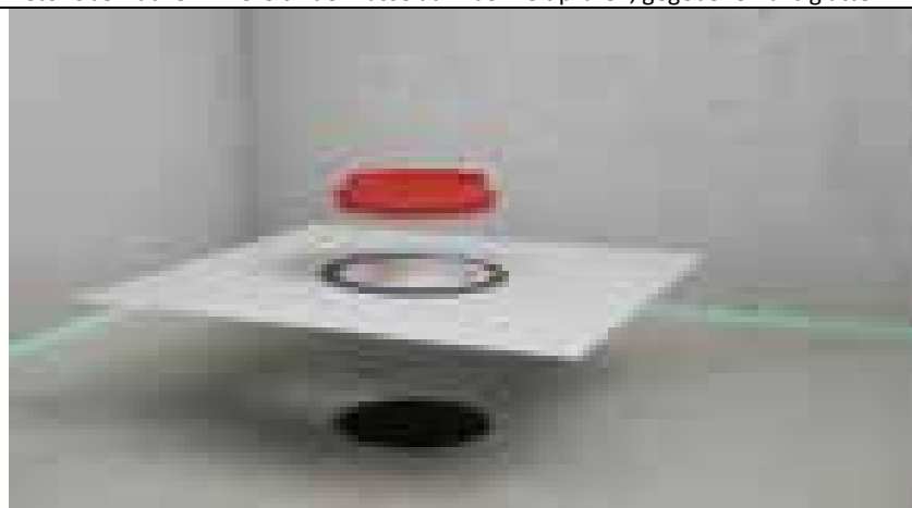
Dichtflansch mit Bauschutz einsetzen