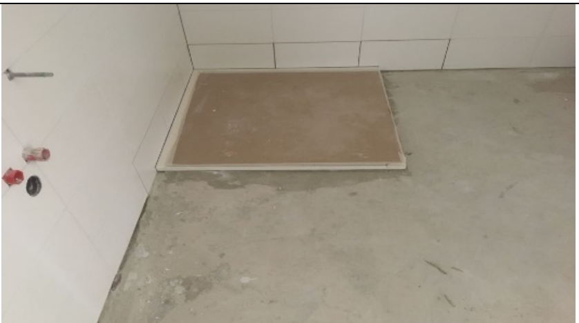
Duschtasse waagrecht in kapillarbrechendem Kleberbett setzen, Wannendichtband mit aufstrebenden Wänden verkleben, Bauschutz herstellen