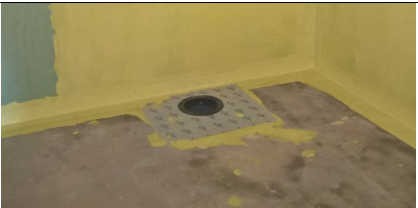
Wandabdichtung und Sekundärentwässerungsebene herstellen, Dichtflansch einbinden