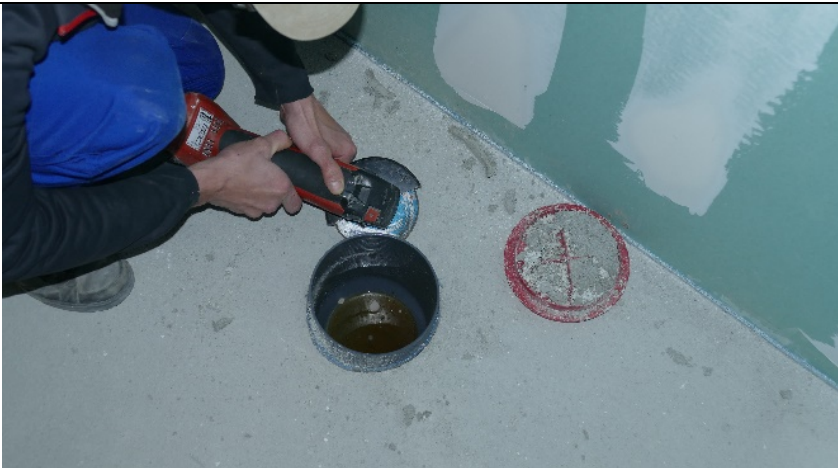
Nach Aushärtung des Estrichs den Halbablaufkörper bodengleich zurückschneiden