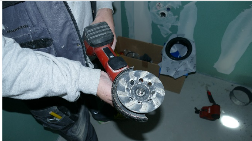
Betonoberfläche im Bereich der Tasse auf Ebenheit prüfen, gegebenenfalls glätten