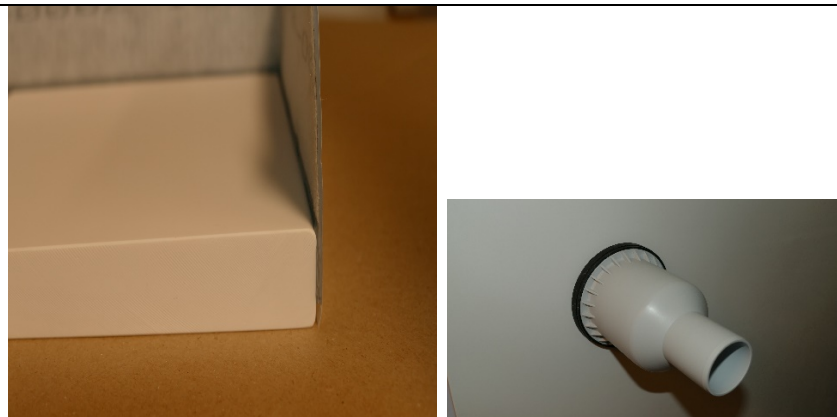
HELOPAL Duschtasse mit Wannranddichtband und oberem Halbablaufkörper komplettieren (o. Halbablaufkörper nach Naturmaß anpassen, Mindestabstand zum Boden vom unteren Ablaufkörper 4 cm)