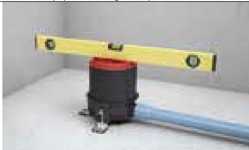
Mit Ablauf verbinden, Dichtheitsprobe durchführen und Bauschutz einlegen. Der Fußbodenaufbau wird im gesamten Badezimmer in einem Arbeitsgang durchgeführt.